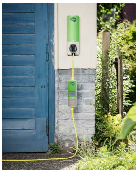
An der Wand im Innen- und Außenbereich