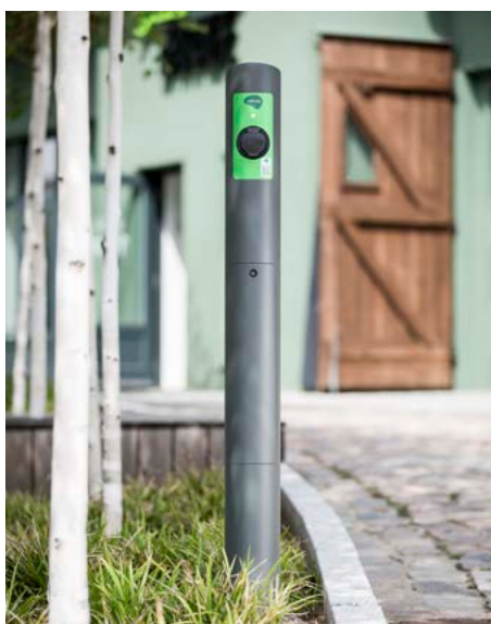
Freistehend als Einzel-/Doppelpoller